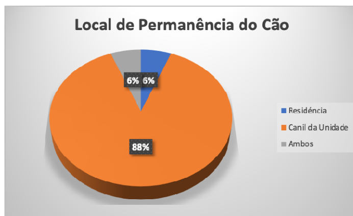
Gráfico 3 - Locais de permanência de cães operacionais (n = 22)