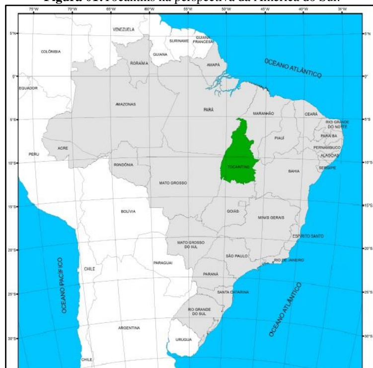
Figura 01: Tocantins na perspectiva da América do Sul.

O Tocantins é o estado mais novo da federação, foi emancipado do Estado de Goiás em 1º de janeiro de 1989, com população estimada para 2018 em 1.555.229, possui a décima maior área territorial do país, mensurada em 277.720,412 km 2 , com o 24º índice populoso do país. Apresenta 56% de sua área para pastagem, com superfície total composta por 60% de solos agricultáveis e 25% com solos condicionados à produção. A vegetação de cerrado é presente em quase 90% do território, com relevo predominante é de planícies e o clima tropical (IBGE, 2019; OLIVEIRA, 2018; TOCANTINS, 2015).