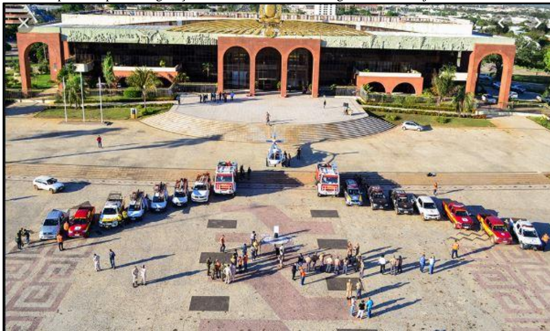
Figura 03: Preparativo para inauguração do Dia D no Palácio Araguaia em 05 de junho de 2019 – Palmas/TO.