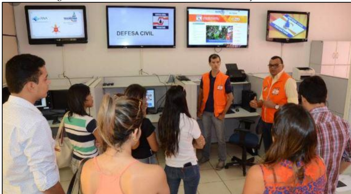
Figura 04: Monitoramento dos focos de calor na Sala de Situação – Palmas/TO.